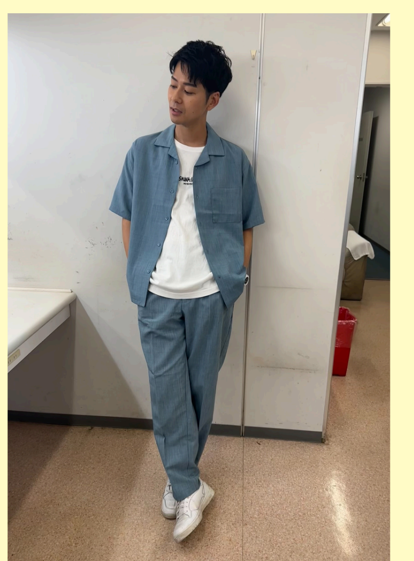
15 カイキンショウ カaira