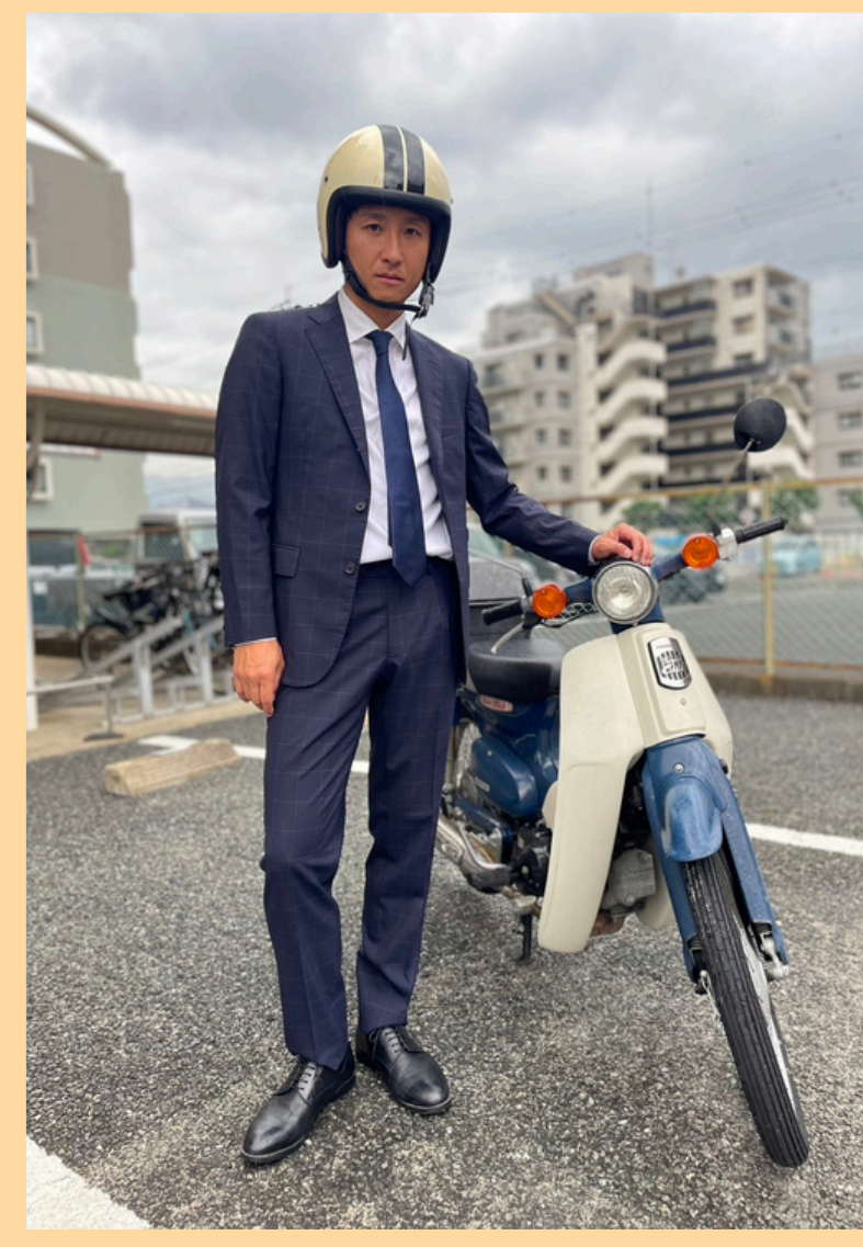
9 メタルラック のなか