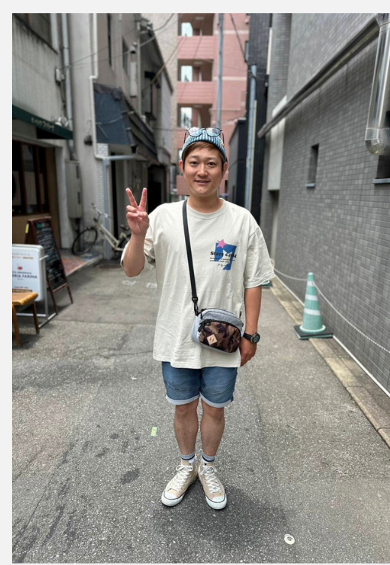
14 カイキンショウ ショウキン