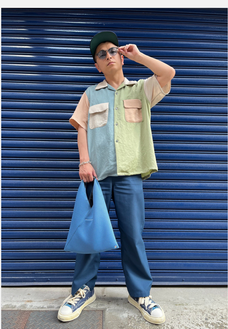
12 シャカリキ ヒロ