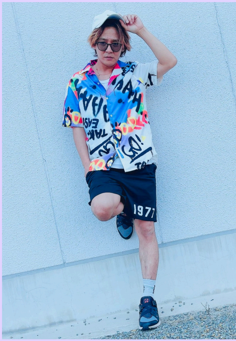
3 サカイスト 伝ペー