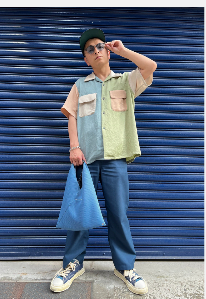
12 シャカリキ ヒロ