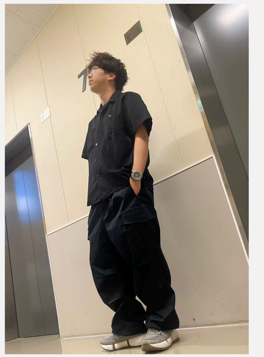
10 メタルラック 美意識タカシ