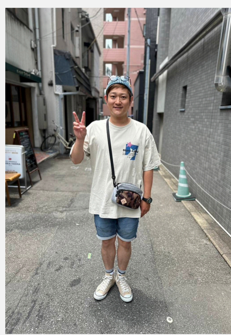
14 カイキンショウ ショウキン