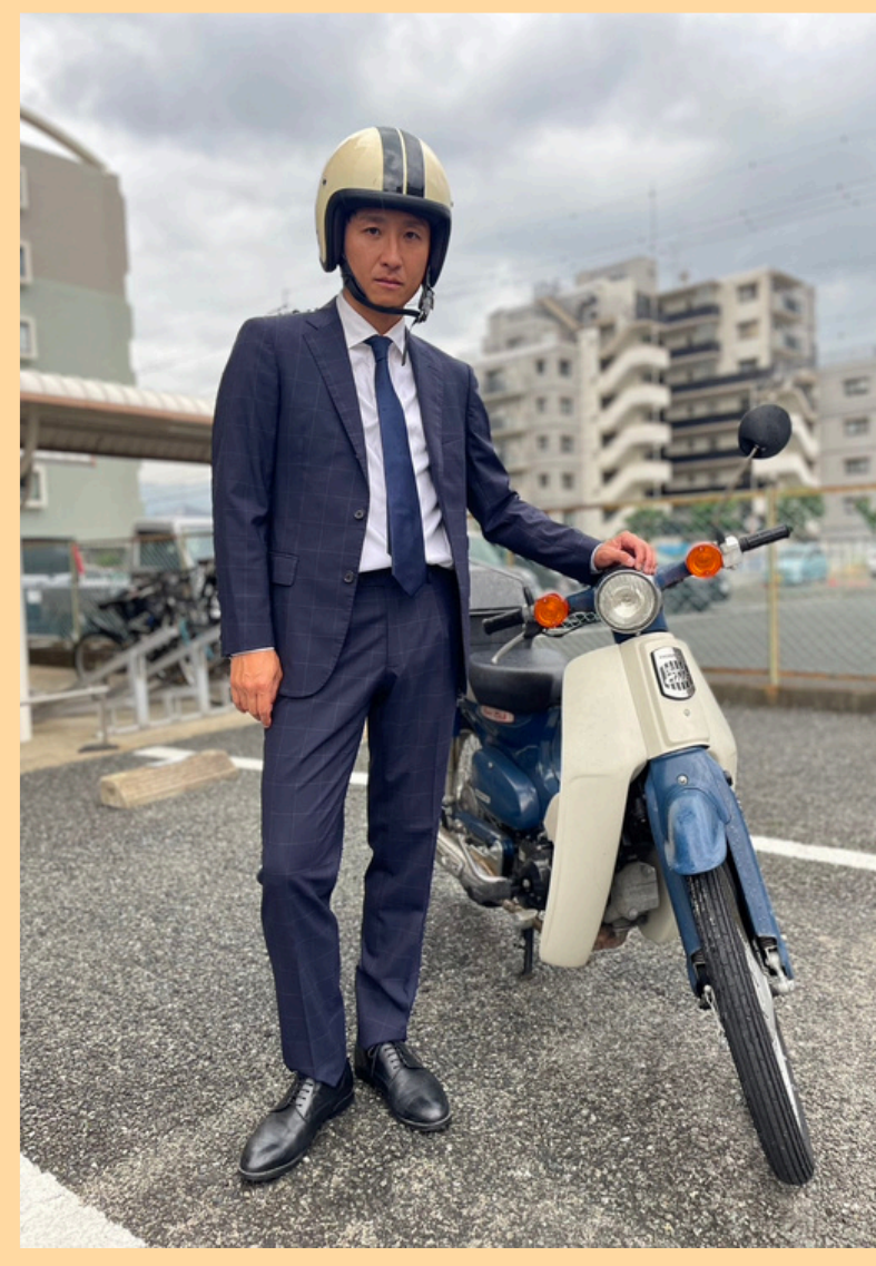
9 メタルラック のなか