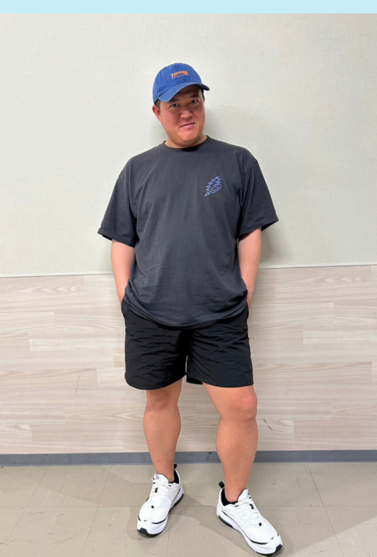
11 シャカリキ 光ママ